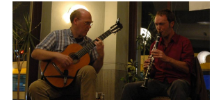
Die Zwei Knicklicht 2010