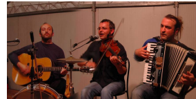
Ciac Boum GBT Vialfrè 10